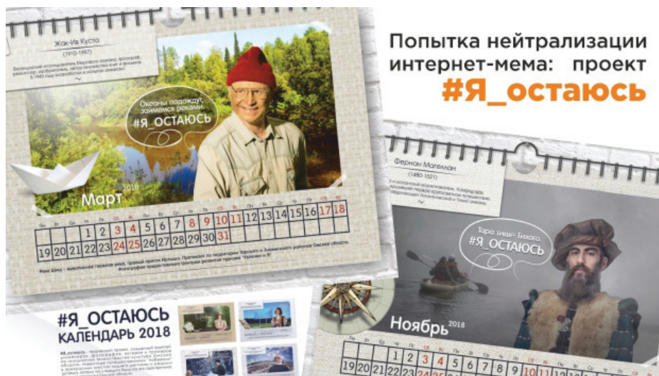
Илл. 2. Проект «#Я_остаюсь», разработанный министерством культуры Омской области