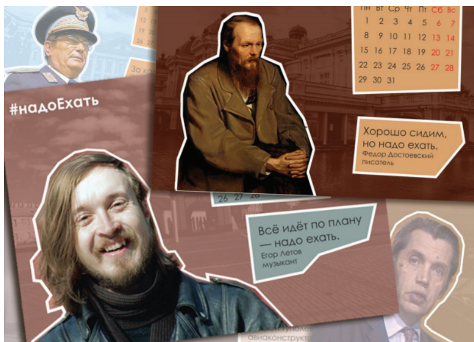
Илл. 3. Альтернативный календарь «#надоЕхать». Автор: Е. Александров