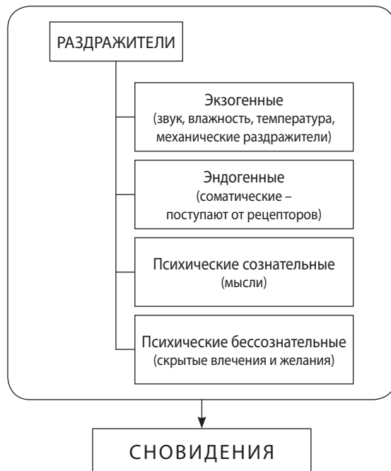
Рис. 2. Классификация раздражителей, интегрирующихся в сновидение

Таким образом, сновидение, функция которого – оберегать сон, представляет собой компромисс между потребностью во сне и желанием, стремящимся нарушить сон. Результатом такого компромисса является галлюцинаторное исполнение влечений и желаний.