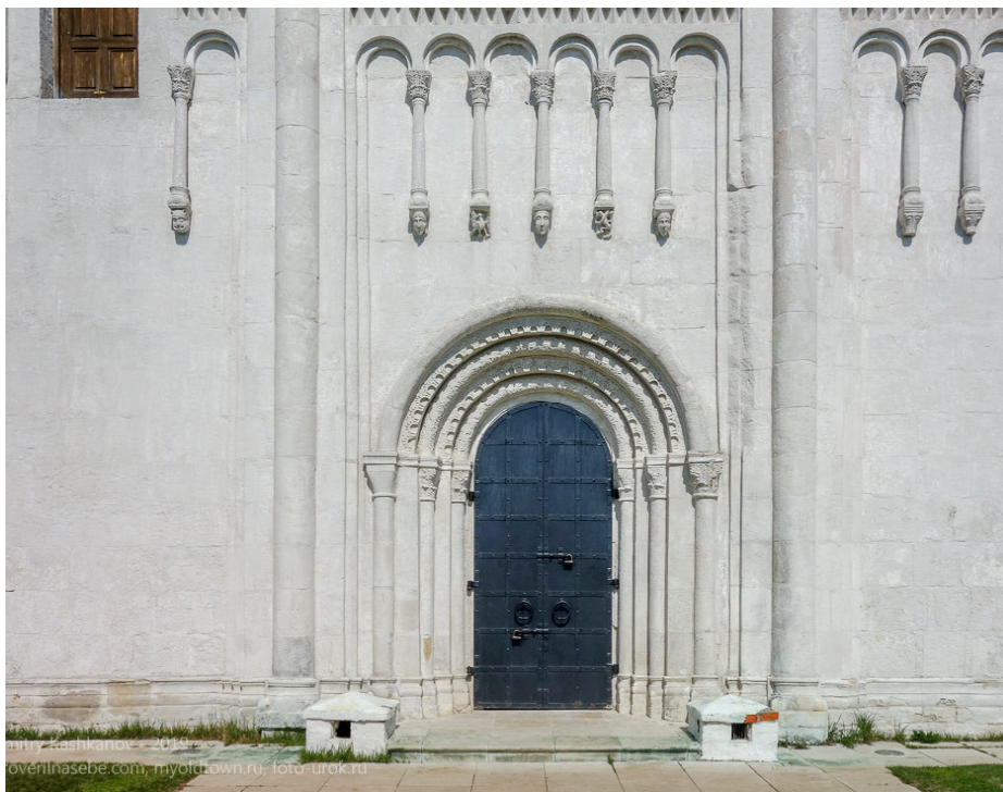
Ил. 2. Храм Покрова на Нерли. Южный портал.

Так, например, перспективный портал, «излюбленный приём романики» [Кудрявцева 1975, 33], сохраняя свою эстетическую нагрузку и свой семантический смысл (в качестве символа перехода из профанного пространства в сакральное), играет совершенно иную роль в синтаксическом строе владимирского фасада (ил. 2). Здесь он никогда не превращается в главный элемент фасадной композиции, что было, наоборот, общим местом романской архитектуры, в которой размеры портала подчеркнута преувеличены, как бы противопоставлены другим элементам декора, дверному проёму и всей плоскости стены [Максимов 1976, 82–84]. В храмах Северо-Восточной Руси портал не является «доминантой в композиции фасада» и не имеет такого подчеркнута обособленного значения, как в романике; он, скорее, «вписывается» в арочный ритм аркатурного пояса, закомарных покрытий и купола», участвуя в создании целостного облика русского крестово-купольного храма [Кудрявцева 1975, 34–35]. Если на Западе портал – это доминанта фасада, не имеющая никакого архитектурного «отзвука» в других формах