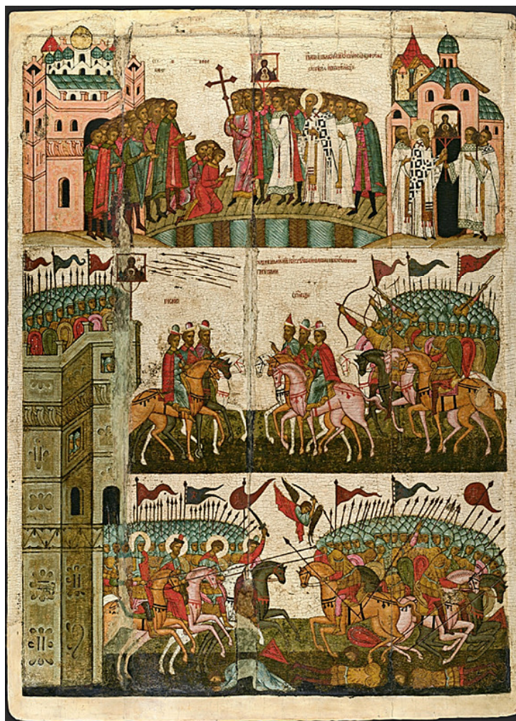
Ил. 3. Битва новгородцев с суздальцами в 1170 году (Чудо от иконы Богоматери «Знамение»). Сер. XV в. Новгородский государственный объединённый музей-заповедник.

ская и римская – здесь, в культурном пространстве Владимира конца XII века, пока ещё сплетены друг с другом. Однако концепт распространения сакрального топоса уже терпит явный ущерб со стороны идеи перемещения центра силы. Отсюда начинается прямой путь к концепции Москвы как третьего Рима, к попытке вывести «Иерусалим» за пределы столицы при патриархе Никоне и, наконец, к созданию новой, уже однозначно «римской» столицы на берегах Невы.