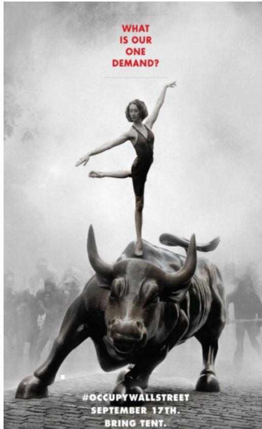
Ил. Призывающий к участию в акции «Захвати Уолл-стрит» плакат с изображением танцовщицы на спине статуи Charging Bull. Балерина на спине быка – символ акции Occupy Wall Street

В Европе, особенно в Испании (тактика « asampados ») и Германии, этому предшествовали символические захваты площадей и университетов. Один из авторов статьи в 2010 г. и сам работал в «оккупированном университете» г. Тюбингена. Университет продолжал работу как ни в чем не бывало, хотя повсюду были развешаны лозунги « Besezt », а в холлах располагались «оккупационные комитеты». (В отечественной практике протеста это, как известно, воплотилось в более информативном лозунге «верни себе город».)