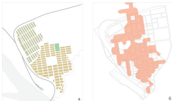
Рис. 1. Центр города Новосибирска: а) в кварталах «плана Кузнецова»; б) в модельной интерпретации урбанистов; в) в разрезе элементарных локально-целостных образований различной степени целостности; г) в разрезе планировочных локально-целостных образований. На схемах в и г увеличение степени целостности показано тональным градиентом от светлого к тёмному